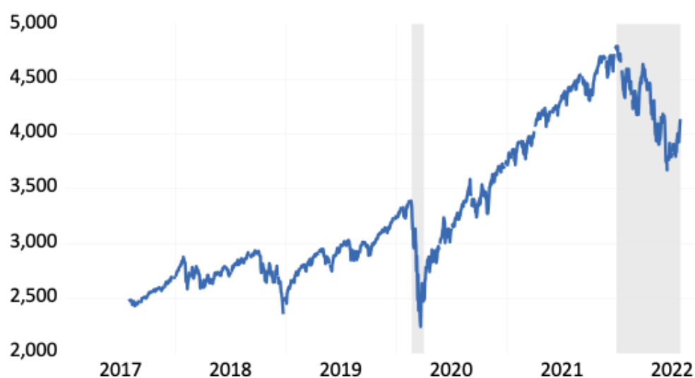
Gráfica 1 Índice Standard and Poor's del Mercado Accionario 2019-2022

Fuente: S&P Dow Jones Indices LLC, accesado en FRED, Federal Reserve Bank of St. Louis (Julio, 2022)