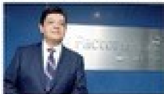
El objetivo El proyecto busca mejorar la calidad de los productos y optimizar los procesos de producción.

El proyecto eFactor Network, una plataforma de financiamiento para proveedores de grandes corporativas, proyecta colocar hasta 60 mil millones de dólares en financiamiento a finales de 2018, un aumento del 30 por ciento respecto a lo que se esperaba al inicio del año.